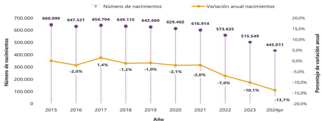
Gráfico. Número de nacimientos y variación porcentual en Colombia Total, nacional Años 2015-2024

Fuente: DANE, Estadísticas Vitales a 31 de marzo de 2025